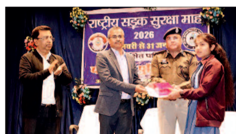
हैं। आम जनता से अपील की गई कि वे अनिवार्य रूप से हेलमेट का उपयोग करें। सड़क सुरक्षा केवल पुलिस विभाग की जिम्मेवारी नहीं है, बल्कि समाज के प्रत्येक नागरिक की