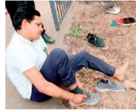
परीक्षा से पहले नूता निकलते अभ्यर्थी।

परीक्षा के दौरान वाशरूम का उपयोग करने वाले परीक्षार्थियों का विवरण व्यापम द्वारा निर्धारित प्रपत्र में किया गया। इसके अलावा प्रत्येक केन्द्र में जैमर की व्यवस्था होने के कारण मोबाइल का सम्पर्क टूटा रहा। परीक्षा के दौरान उपयोग में लाई जाने वाली ओ.एम.आर.उत्तर शीट में परीक्षार्थियों को यह आकड़ों में प्रविष्ट करना पड़ा कि उन्होंने कितने प्रश्न हल नहीं किए हैं।