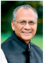
बुनियादी मुद्दों पर सरकार कोई ठोस घोषणा करने में असफल रही है।