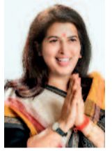
जैसी चीजें भविष्य और वर्तमान की जरूरतों का ध्यान रखती हैं।

भाजपा की राष्ट्रीय उपाध्यक्ष सरोज पांडेय ने बजट को चौतरफा विकास और अपार अवसरों का राजमार्ग बताया है। उन्होंने कहा कि केंद्रीय बजट वर्तमान के सपनों को साकार करता है। भारत जिस रिफॉर्म पर सवार है, बजट से उसे नई गति मिलेगी। बजट छत्तीसगढ़ को विकास की मुख्य धारा में और मजबूतीस जोड़ने वाला साबित होगा। बजट में स्नरहाइज सेक्टर को खास महत्व दिया गया है। रेयर अर्थ कोरिडोर, किरिटिकल मिनिस्ट्रस पर बल, टेक्सटाइल, हाईटेक टूल मैनुफैक्चरिंग