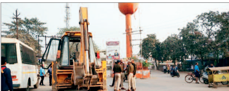
सुपेला संडे मार्केट में अवैध कब्जा हटाते पुलिस व निगम कर्मचारी।

सुपेला संडे मार्केट क्षेत्र में तीसरे रविवार को भी बुलडोजर चला। भिलाई निगम व पुलिस प्रशासन द्वारा संयुक्त रूप से यह कार्रवाई की गई। घड़ी चौक, सुपेला से गदा चौक, सुपेला तक सड़क किनारे किए गए अतिक्रमण हटाए गए। पूरा मार्ग रविवार को खाली सा दिखाई दिया। लोग बेहतर तरीके से आवागमन करते दिखे। इस बार कार्रवाई के पहले ही दुकानदारों ने अपने सामान सड़कों पर निकालने के बजाय अपने दायरे में ही सजा कर रखी। बीच सड़क से ठेले से कारोबार करने वाले भी नहीं दिखे।