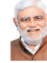
रियायत से राहत मिलेगी।