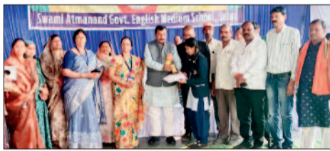
■ स्वामी आत्मानंद विद्यालय सेलूद में वार्षिक पुरस्कार वितरण समारोह संपन्न

शासकीय अंग्रेजी माध्यम स्वामी आत्मानंद विद्यालय सेलूद में शुक्रवार को विद्यालय प्रांगण में भव्य वार्षिक पुरस्कार वितरण समारोह का आयोजन किया गया। समारोह में विभिन्न कक्षाओं में प्रथम, द्वितीय एवं तृतीय स्थान प्राप्त करने वाले विद्यार्थियों के साथ-साथ खेलकूद, सांस्कृतिक एवं अन्य सह-शैक्षणिक गतिविधियों में उत्कृष्ट प्रदर्शन करने वाले छात्र-छात्राओं को प्रशस्ति पत्र एवं पुरस्कार प्रदान कर सम्मानित किया गया।