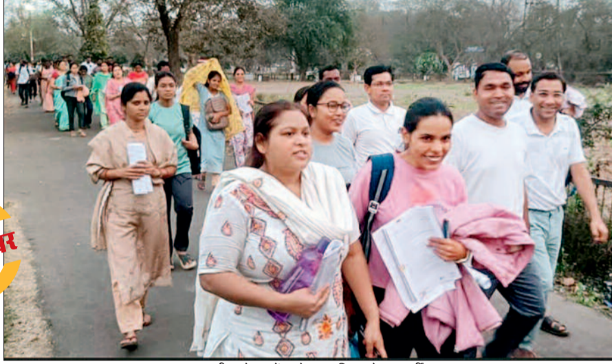
परीक्षा देकर केन्द्र से बाहर निकलते अभ्यर्थी।

व्यवसायिक परीक्षा मण्डल रायपुर द्वारा रविवार को दो पालियों में शिक्षक पात्रता परीक्षा (टेट) की परीक्षा आयोजित करवाई गई। सुबह पाली की परीक्षा में महिला परीक्षार्थियों की संख्या अधिक थी। प्रत्येक परीक्षा केन्द्र में इस बात का कड़ाई से पालन किया गया कि व्यापम द्वारा निर्धारित वेशभूषा एवं चपल पहनकर ही परीक्षा केन्द्र में प्रवेश दिया गया। अनेक महिला परीक्षार्थियों द्वारा उनके आभूषण पहने जाने के कारण परीक्षा केन्द्र में उन्हें आभूषण उतरवाने के बाद परीक्षा केन्द्र में प्रवेश दिया गया। दोनों पालियों में परीक्षा आरंभ होने के 30 मिनट पूर्व बंद कर दिया गया जिसकी विडियो ग्राफी भी कराई गई।